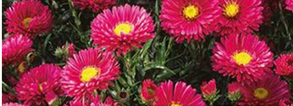
1 Aster dumosus Jenny